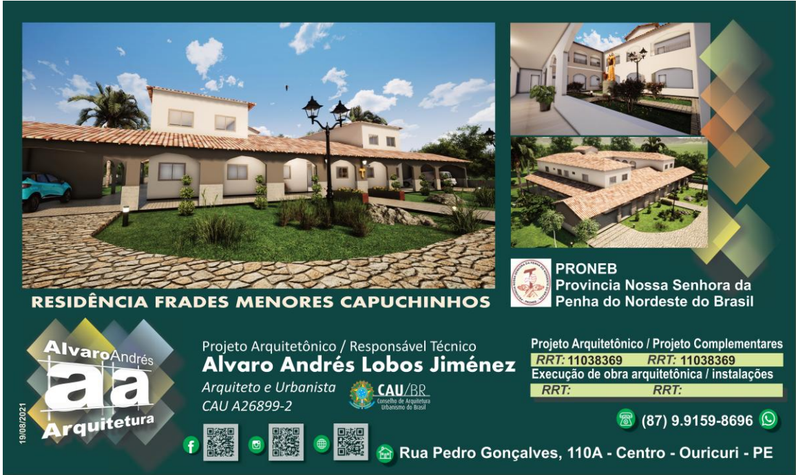
Placa de Obra