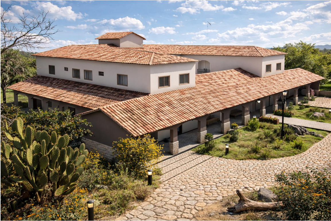
Figura 1 – perspectiva geral do projeto